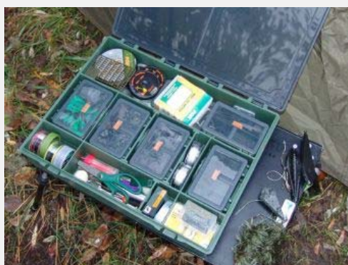
B.Richi - Tackle Box Big-Deal

Die zwei B-Boxen bestehen aus einer hellgrünen Bodenschale mit durchsichtigem Deckel und sind aus ordentlichem, temperaturbeständigem Plastik gefertigt. Ganz wichtig: Das Material scheint weichmacherresistent zu sein, wie zumindest eine einwöchige Lagerung meiner Gummifischsammlung belegt. Also sollte auch der Verwendung durch Raubfisch-Spezies nichts im Wege stehen! Die Boxen sind wirklich geräumig, die größere misst 36x30x6 cm, während ihr kleiner Bruder mit 27x20x6 cm immer noch ziemlich viel Platz bietet.