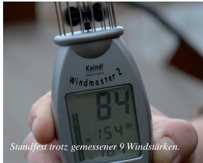
Standfest trotz gemessener 9 Windstärken.

Du sollst niemals an einer neuen Angelstelle zum ersten Mal bei Dunkelheit aufbauen –