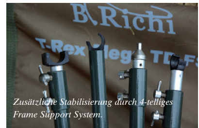
Zusätzliche Stabilisierung durch 4-teiliges Frame Support System.

erfahrungsgemäß besonders reichlich. Kein Problem, denn kräftiges Material (5000mm Wassersäule) und sauber versiegelte Nähte sorgen dafür, dass kein Regen durchkommt. Für schlechtes Wetter und Kälte empfehle ich die Anschaffung des optional erhältlichen