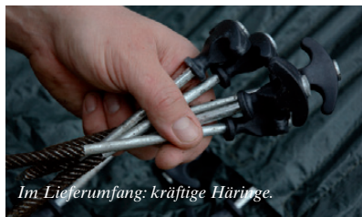
Im Lieferumfang: kräftige Häringe.

entweder komplett verschließen, oder über einen Reißverschluss ganz entfernen. Auch die innere Front kann bei Bedarf aufgerollt und festgeklippt werden. Im Sommer ist das sicherlich eine besonders angenehme Option. Zum Verschließen stehen jeweils entweder