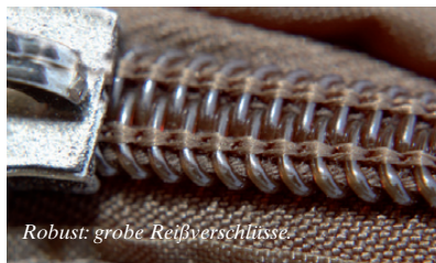
Robust: grobe Reißverschlüsse.

fädeln muss, sehr schnell aufbauen. Besonders, wenn man sich den Innenraum nicht teilen muss, kann man sich platzmäßig