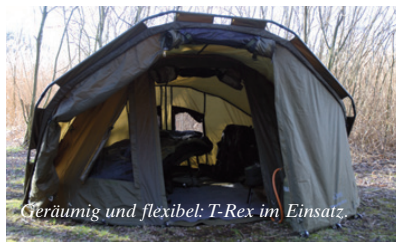
Geräumig und flexibel: T-Rex im Einsatz.

so richtig austoben und braucht nicht jeden Zentimeter Stauraum zu verplanen. Sehr praktisch ist die räumliche Aufteilungsmöglichkeit zwischen Innenraum und Vorzelt. Dadurch bleibt es immer aufgeräumt und unwichtigere Dinge und Gerätschaften können ausgelagert werden.