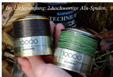
Im Lieferumfang: 2 hochwertige Alu-Spulen.

Freilaufsystem immer weiter verfeinert und optimiert. Dennoch bin ich für meine eigene Fischerei bald auf die Verwendung anderer Rollen mit größerem Spulendurchmesser und Kopfbremse umgestiegen. Der Schnurabzug beim Biss wurde fortan über die Bremseneinstellung geregelt und nach einer kurzen Eingewöhnung habe ich einen separaten Schnurfreilauf eigentlich nicht mehr vermisst.