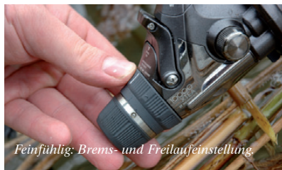
Feinfühlig: Brems- und Freilaufeinstellung.

Ich kann mich noch gut an meine ersten Freilaufrollen von Shimano erinnern. Ich war