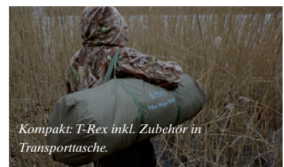
Kompakt: T-Rex inkl. Zubehör in Transporttasche.

Das T-Rex lässt sich sehr flexibel und in vielen Variationen aufbauen und kann dadurch mit wenigen Handgriffen an neue Situationen bzw. Witterungsbedingungen angepasst werden. Die äußere Vorderfront lässt sich z.B.