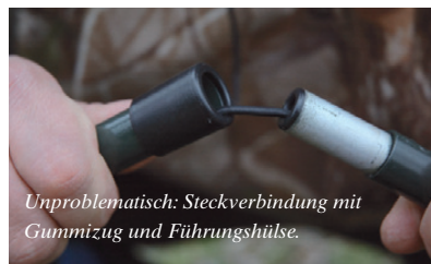
Unproblematisch: Steckverbindung mit Gummizug und Führungshülse.

behaupten, denn nach dem Sturmtief „Kyrill“ haben wir beim Angeln immerhin noch 9 Windstärken gemessen, ohne dass sich mein Zelt davon hätte beeindruckt lassen. Spätestens unter solchen Bedingungen lernt man ein geschlossenes Zelt mit dickem Boden und allem Zick und Zack durchaus zu