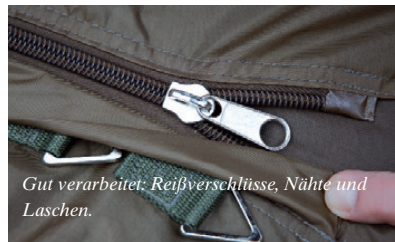
Gut verarbeitet: Reißverschlüsse, Nähte und Laschen.

Ganz klar, da bin ich mit meinem einfachen Ovalschild etwas schneller. Allerdings habe ich damit auch kein so standfestes Dach über dem Kopf. Und das kann ich wirklich