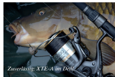
Zuverlässig: XTE-A im Drill.

Inzwischen ist nun die komplett überarbeitete Super Baitrunner Aero XTE-A auch in der für viele Karpfenangler interessanten 10000er