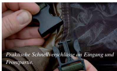
Praktische Schnellverschlüsse an Eingang und Frontpartie.

und ganz sicher nicht ein neues Zelt, wenn die Kopflampe strommäßig aus dem letzten Loch pfeift! Ja, der erste Einsatz von meinem neuen T-Rex stand unter keinem guten Stern. Aber obwohl mein erster Anlauf unter erschwerten Bedingungen sicherlich etwas unbeholfen ausgesehen haben muss, war es am Ende kein Problem das Gestänge in die richtige Position zu bringen. Schließlich rutschen die über einen innenliegenden Gummizug verbundenen und mit entsprechenden Einsteckhülsen versehenen Einzelteile der Rahmenkonstruktion beim