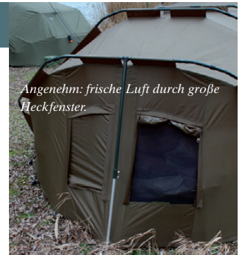
Angenehm: frische Luft durch große Heckfenster.

schätzen. Im Inneren bietet das T-Rex Mega nicht zuletzt durch fast aufrecht stehende Seitenwände ausreichend Platz für 2 Liegen. Überflüssiges Zubehör lässt sich zudem in dem überdachten und über die Außentür ebenfalls zu schließenden Stauraum vor dem eigentlichen Innenzelt unterbringen. So steht z.B. die Gasflasche oder eine Kühlbox mit Fressalien nicht im Zelt, aber trotzdem nicht im Regen. Das habe ich während meiner Ansitze durchaus als Luxus empfunden, denn Regen fällt in unseren Breitengraden während der ausgedehnten Winterregenzeit